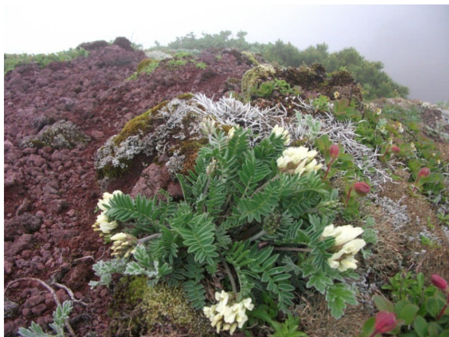
リシリゲンゲ (初めて見ました)