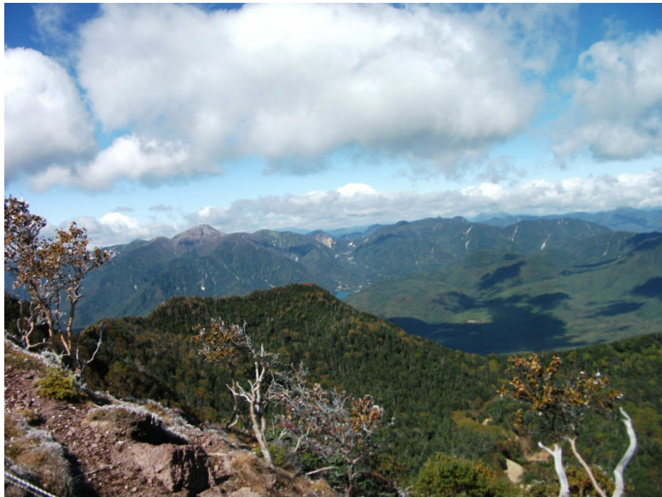
111003 奥日光 日光白根山（山頂より）