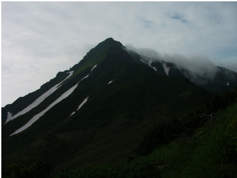
雲の切れ間より見えた利尻山頂