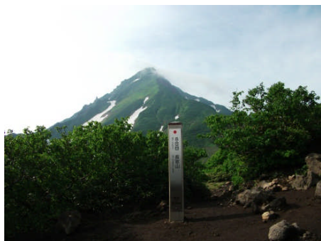
8合目（長官山）より山頂