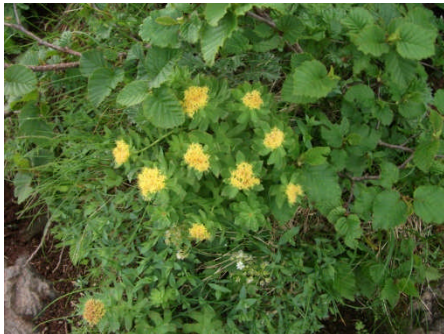
ホソバイワベンケイ