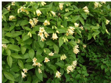
ウコンウツギ (初めて見ました)