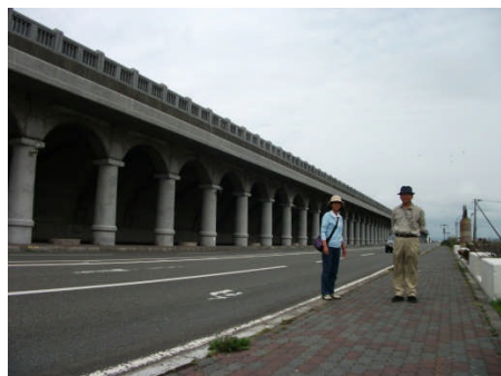
防波堤（玄関口の稚内港）