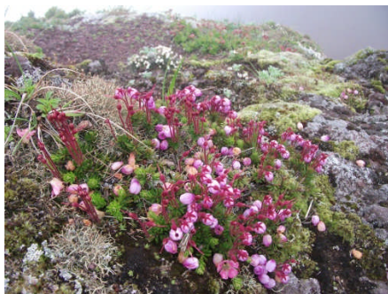
エゾノツガザクラ